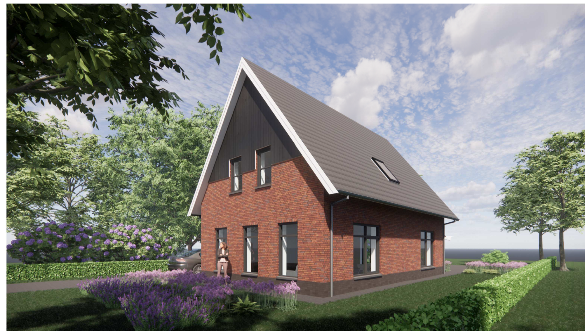
3D 2022-10-12-16-33 (Enscape)