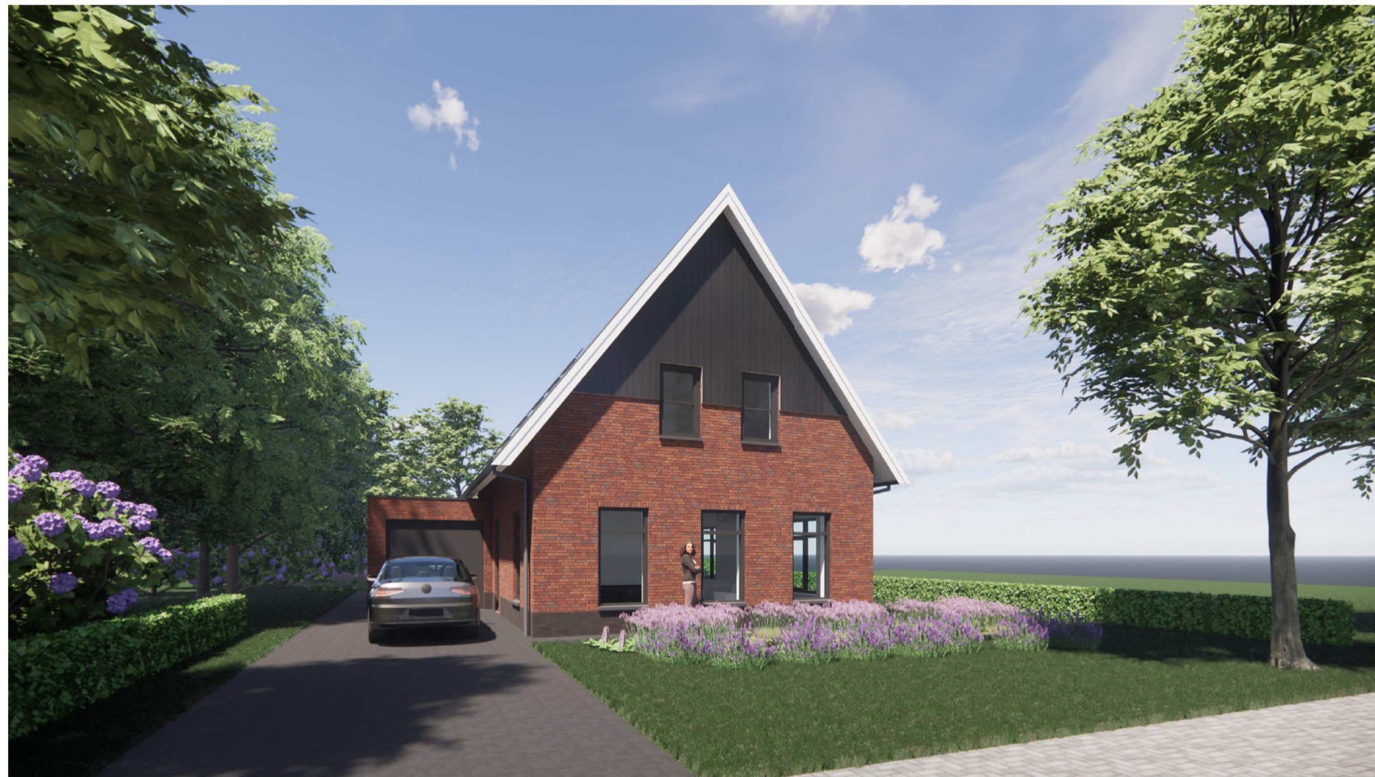
3D 2022-10-12-15-11 (Enscape)