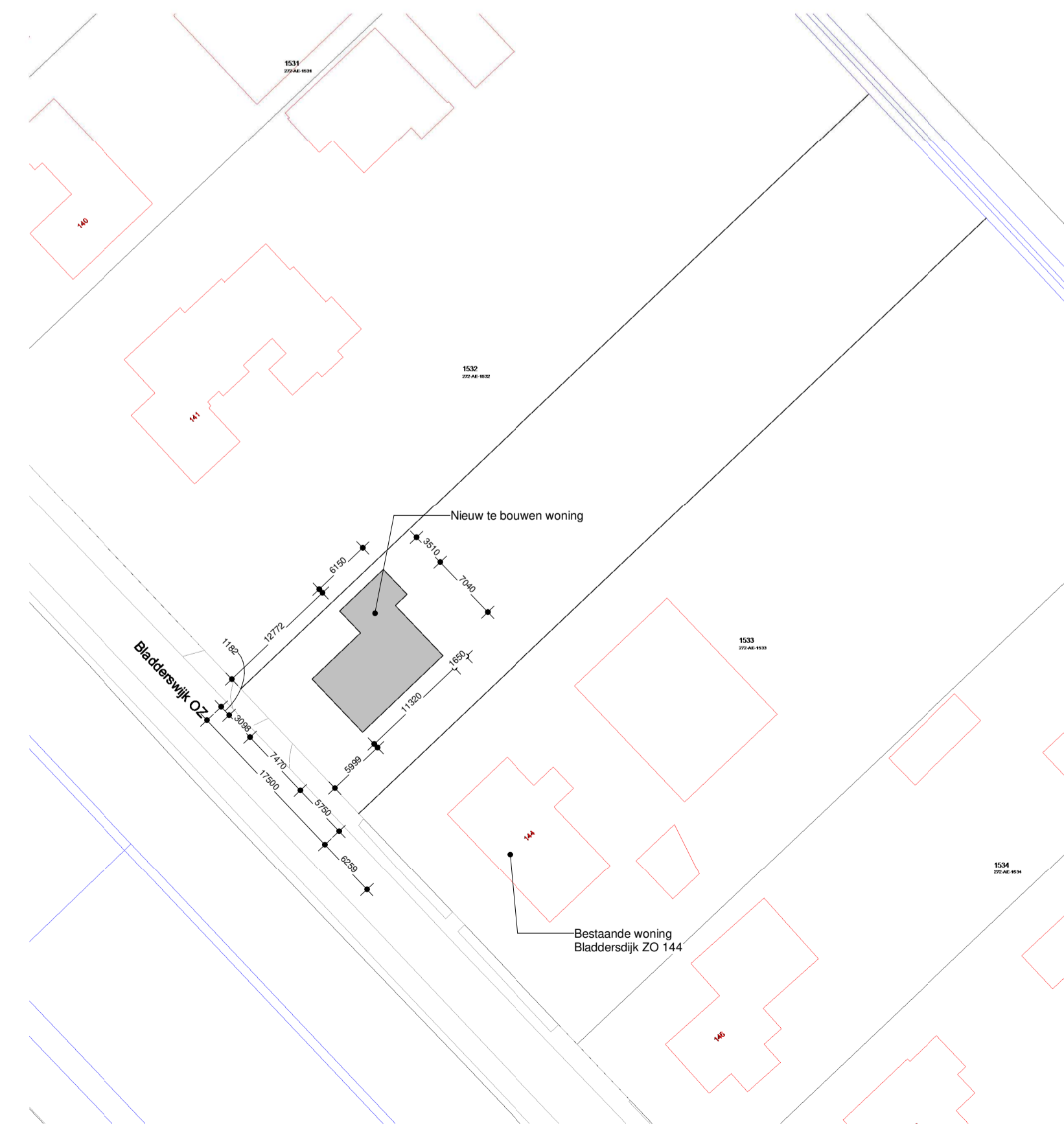
Situatie 1:500 Bladderswijk OZ 144 7885 TK Nieuw-Dordrecht